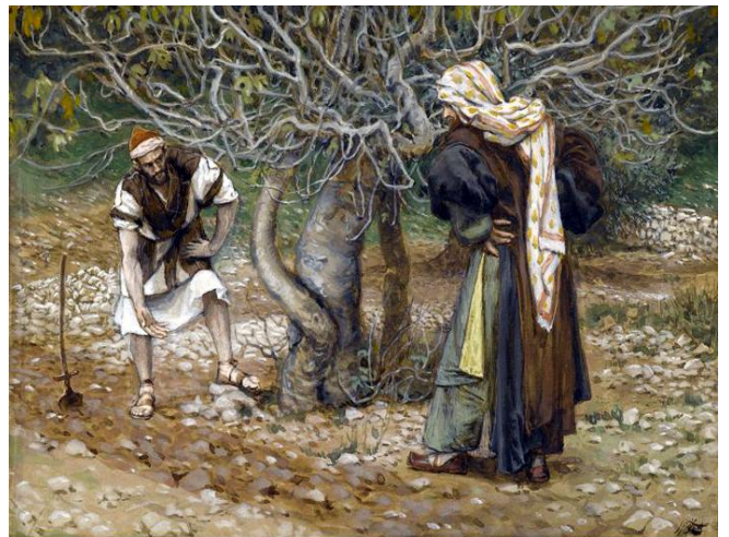
The Vine Dresser and the Fig Tree by James Tissot

Liedvers vor der Predigt _____ ELKG 118, 8